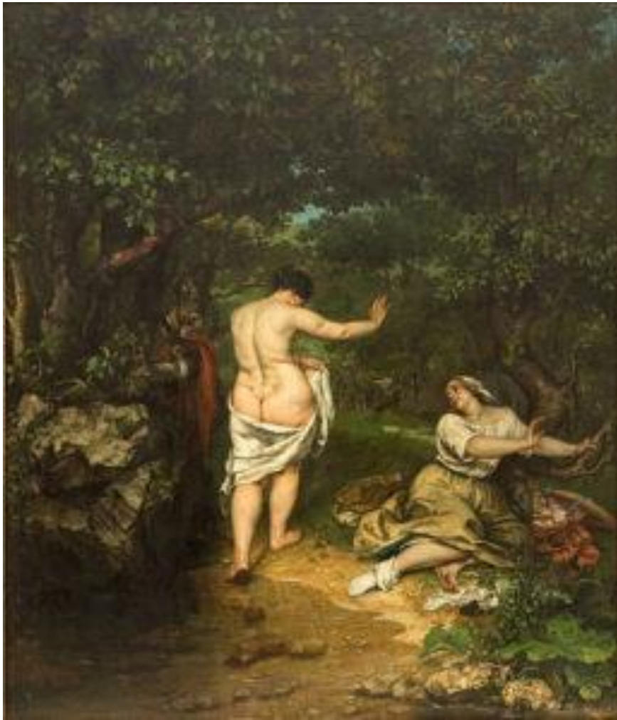
« Les Baigneuses », 1853

Des critiques, Courbet en reçut aussi de ses amis. Le philosophe Proudhon et le poète Baudelaire, qui avaient pris la pose, estimèrent que leur ami peintre les avait enlaidis. Les critiques de ses modèles le rendaient fou de rage, car elles venaient à l'encontre de son obsession de la vérité dans ses œuvres. Embellir la réalité n'était pas envisageable même pour des amis.