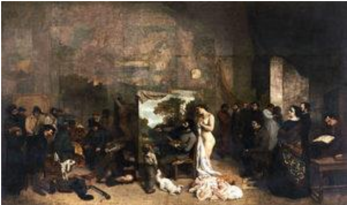
« L'Atelier du peintre », 1855