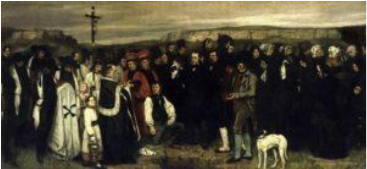
« Un Enterrement à Ornans », 1849-50

Après toute cette agitation à propos de son style, Courbet retourna un temps s'isoler dans son village. Mais tout le monde était déjà au courant ce qu'il s'était passé au Salon et on ne lui réserva pas le même accueil