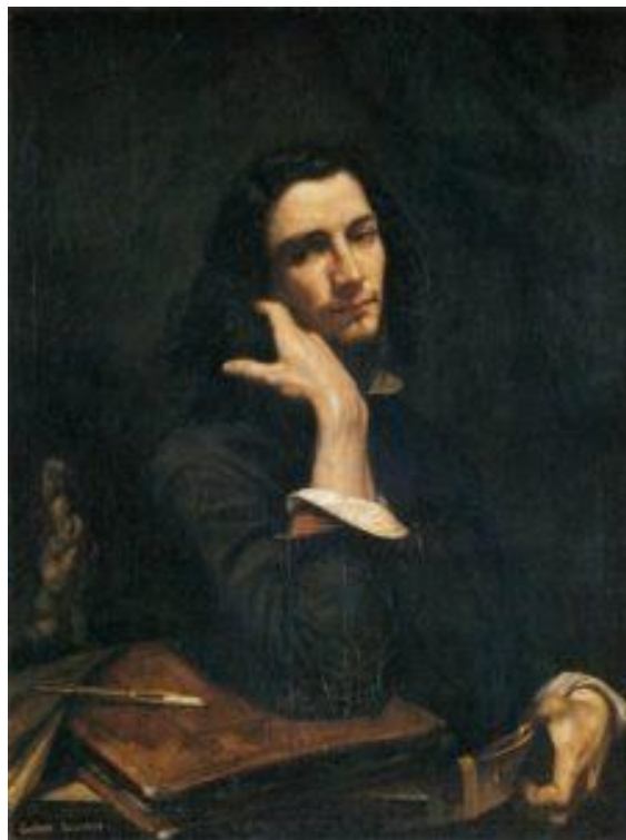
« L'Homme à la ceinture de cuir », 1845-1846

Au salon de 1849, Courbet présenta 7 toiles qui furent une nouvelle fois toutes admises. Deux œuvres eurent un grand succès: un portrait « l'Homme à la ceinture de cuir » (oeuvre qui fut achetée par l'État après la mort du peintre) et une scène de genre « l'Après-dînée à Ornans ».