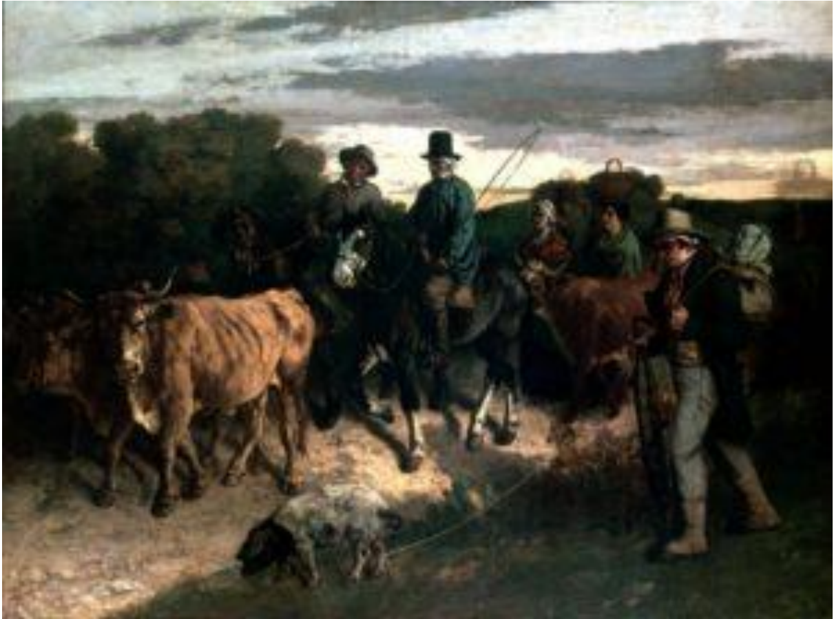
« Les Paysans de Flagey revenant de la foire », 1850