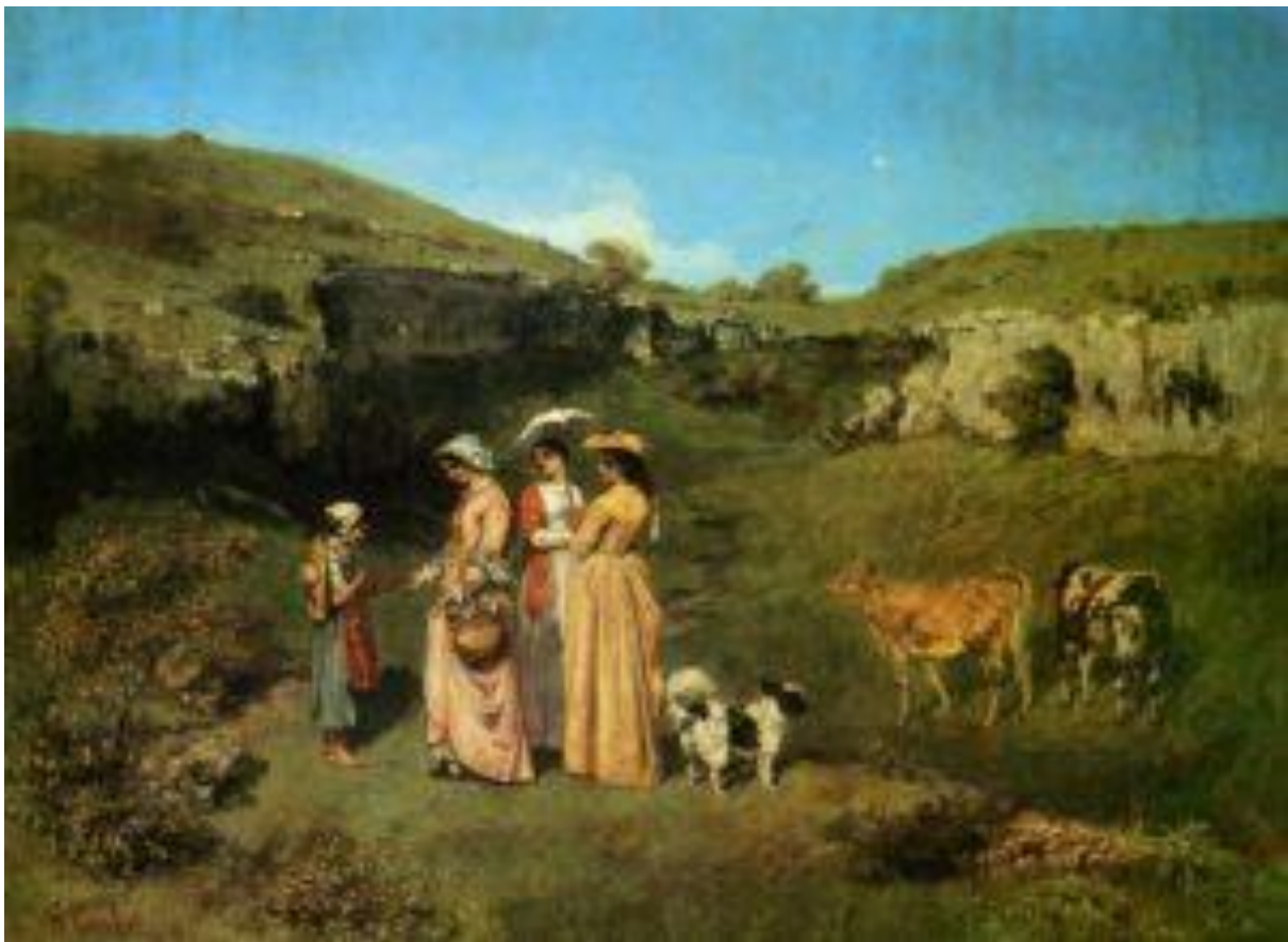
« Les demoiselles du village », 1851

Il décida alors de prendre à contre-pied la critique. Il réalisa « Les Demoiselles de village », œuvre dans laquelle il fit figurer ses sœurs. La peinture fut envoyée au salon de 1852 et vendue avant même d'être exposée. Pour autant, cela ne calma pas la critique qui fut toujours aussi violente. Et parmi ses détracteurs les plus virulents, on compte un ancien soutien, Delacroix. Ainsi, Courbet ne pouvait même plus compter sur le « Gracieux ».