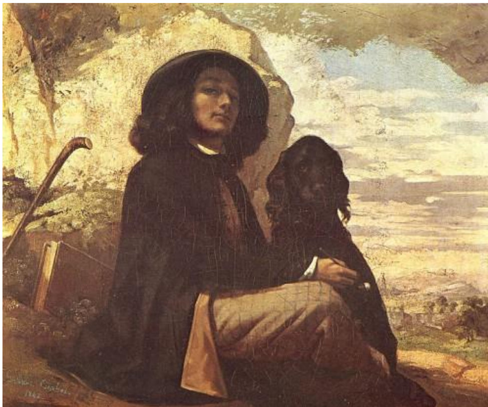
« Autoportrait au chien noir », 1842

Son image, Courbet savait l'utiliser d'autant plus qu'elle laissait transparaître une pointe de romantisme, ce qui était vraiment à la mode à cette époque. Cela lui permit de franchir les portes du Salon pour la première fois avec son « Autoportrait au chien noir », oeuvre peinte en 1842 et exposée alors en 1844.