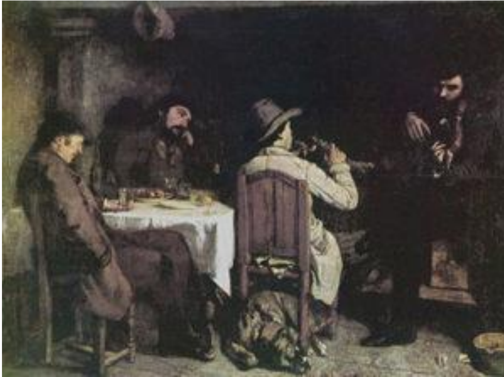
« L'Après-dînée à Ornans », 1849

Concernant cette scène de genre, les avis furent partagés. Delacroix cria au génie et félicita chaleureusement Courbet. Ingres fut bien plus mitigé. S'il reconnaissait les talents rares de Courbet, il trouva dommage d'utiliser de tels dons pour produire une « œuvre aussi vulgaire ». Enfin, les proches de Courbet durent arracher au critique d'art Théophile Gautier quelques louanges.