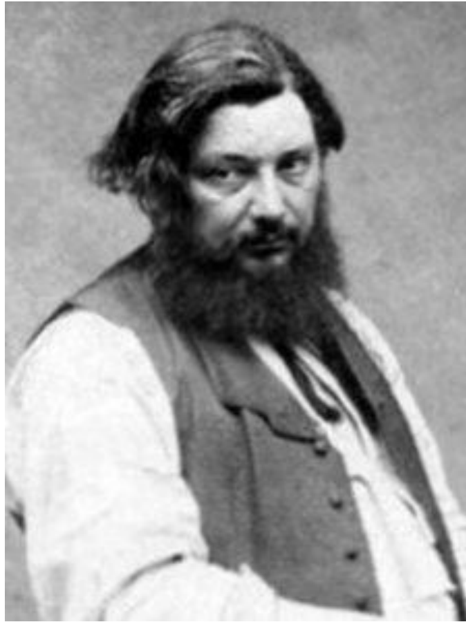
Courbet Gustave, 10 juin 1819 – 31 décembre 1877