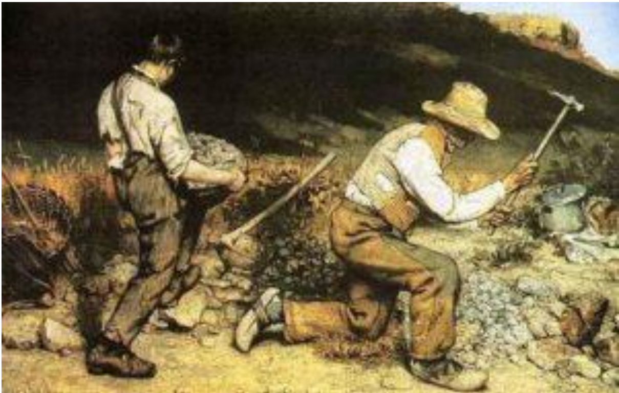
« Les Casseurs de pierre », 1849-1851

Enfin, « Les Paysans de Flagey revenant de la foire » fit scandale également, mais dans une moindre mesure. L'œuvre mit le public mal à l'aise, car elle montrait, sans chercher à l'embellir, une réalité fort banale, voire triviale, et hissait une scène de genre au rang de peinture d'histoire.